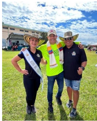
Multicultural Fall Festival , Kissimmie,FL, St. Catherine of Siena Church, domingo, 16 octubre