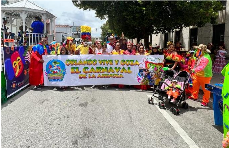
Reunión Director Programa Colombia Nos Une, Casa del Carnaval No. 2 , jueves, 23 de junio