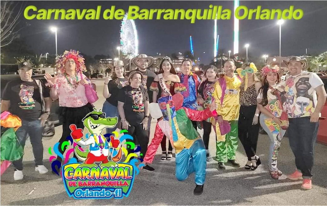
Participación fiesta Carnaval, Discoteca Capri, sábado 26 de marzo